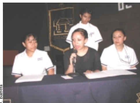
Las primeras exponentes de la XXVII edición del seminario.