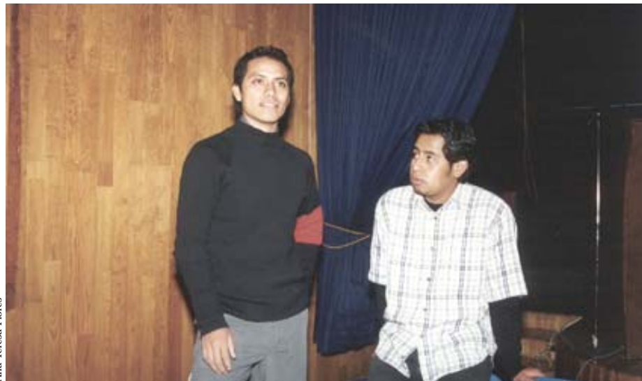
Promotores del Festival de Festivales.

Por otro lado, informaron que este primer ciclo consta de cinco proyecciones; las dos