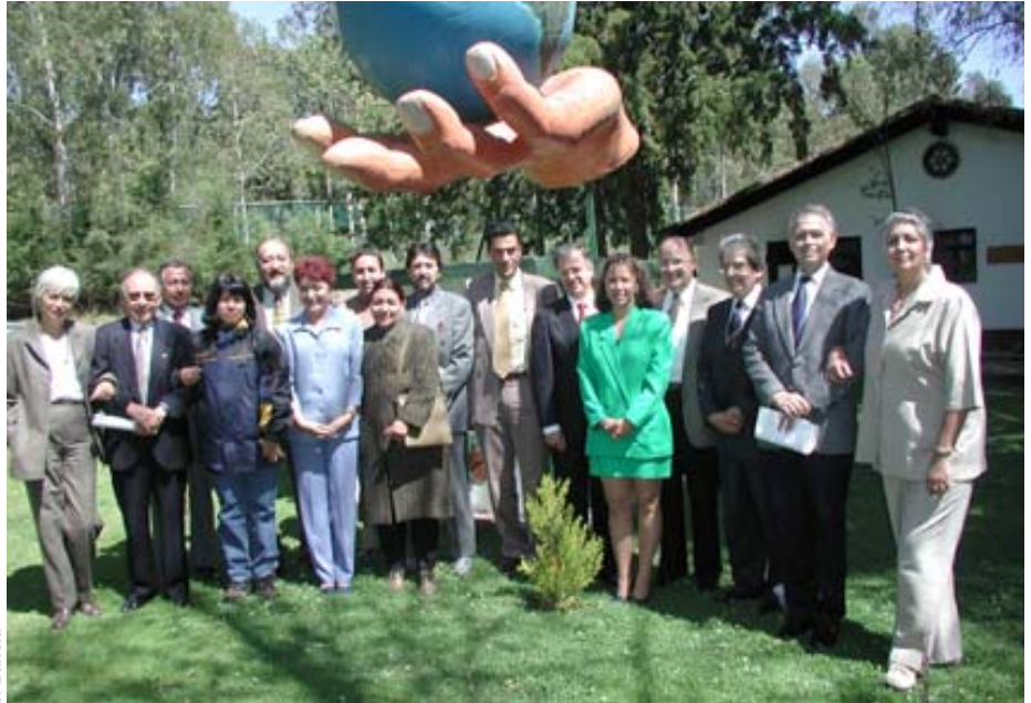
Para el recuerdo.

Recordó que aun cuando en Omeyocan es posible realizar eventos sociales, uno de