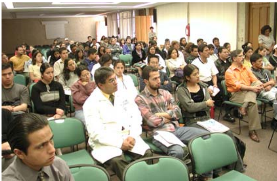
Académicos y estudiantes de todas las disciplinas impartidas en Iztacala, asistieron a la conferencia.