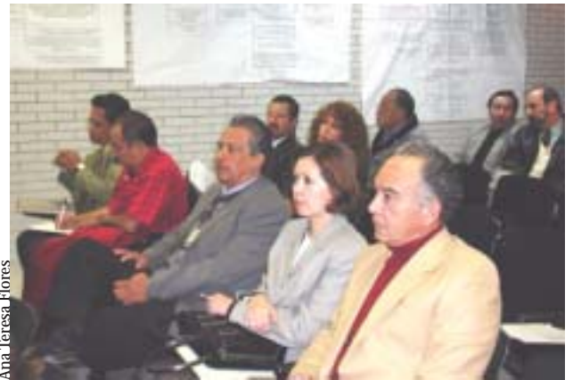
Asistentes a la presentación del P.I.O.

Para finalizar su discurso, exhortó a la comunidad odontológica a organizar y realizar investigación acerca de los problemas que ponen en peligro la salud bucal e integral de la población para dar respuesta a las demandas de la sociedad y contribuir a la autodeterminación científica y tecnológica de