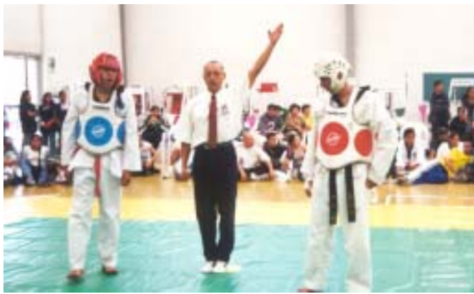
Por 14 puntos a 1, el taekwondoin iztactalteca apabulló a su rival de la E.N.E.F.