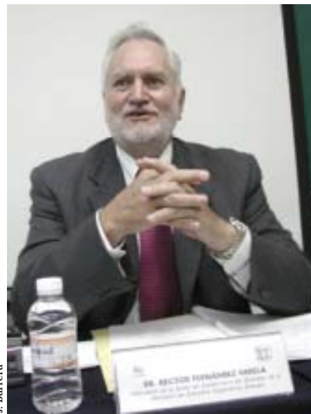
El fundador de Iztacala y creador de la UIICSE.

Desde el 15 de marzo de ese año, día de su inauguración y hasta la fecha, sin descanso y con entusiasmo, los investigadores de la UIICSE han venido fortaleciendo lo que hoy es una brillante realidad de la cual la comunidad de Iztacala debe sentirse orgullosa, concluyó Fernández Varela.