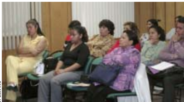
J. Barrera Asistentes al encuentro.

Mencionó que en las relaciones interpersonales influye la manera en cómo