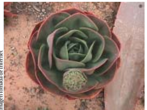
Parece una pequeñísima rosa, pero se trata de Echeveria .

Señaló que el género Echeveria también es muy numeroso, existen entre 130 y 140 especies en México, y se caracteriza por rosetas, tallos simples o a veces ramificados, hojas con base cuneada que lleva una vena por hoja, la inflorescencia siempre es lateral, que puede ser en panícula, espiga o racimo; los pétalos están imbricados y son de colores brillantes, en tanto que Dudleya , presente en Baja California y California, presenta hojas abrazadoras o amplexicaules, con varias venas; la inflorescencia es en panícula; sus pétalos son convolutos y presenta colores pálidos.