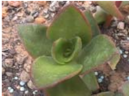
La minúscula Crassula .

Indicó que al clasificar las crasuláceas se debe tomar en cuenta el número de pétalos, de estambres, tipo de inflorescencia; si los pétalos son libres o connados, etc. Por ejemplo, el género Kalanchoe tiene cuatro pétalos, Cotyledon y Echeveria tienen cinco, y a partir de éstas siguen las demás, excepto en Sempervivoideae que varía de 6 a 32 pétalos.