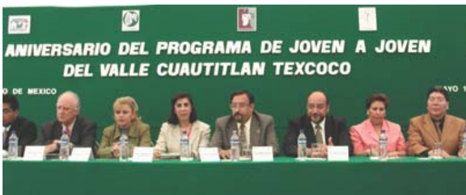
Durante la inauguración del 50. aniversario del programa.

Participa en su organización, académico de la FES-I