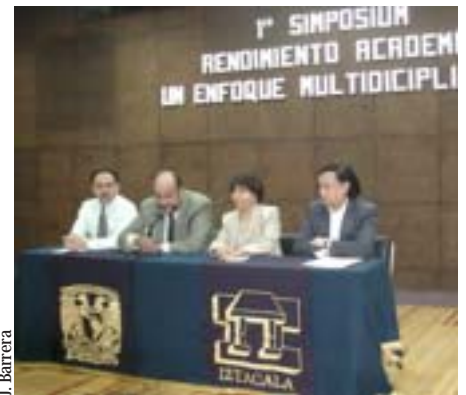
Los conductores del proyecto.

Luego de aclarar que si bien existe una gran cantidad de escuelas, muchas de las cuales no ofrecen un servicio de calidad, Ramiro Jesús destacó el papel de los