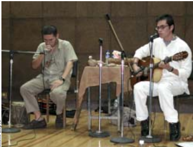
Nahualitzin en acción.

Con esta combinación de sonidos e instrumentos, el grupo busca abrir el camino que permita el retorno a las raíces de la creación musical indígena, que en su momento se conjuntó con la ibérica en las leyendas y en las canciones.