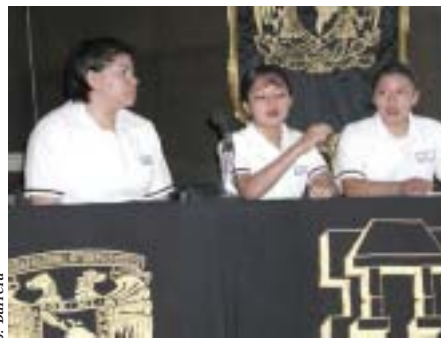
La presentación de los Procesos de Atención de Enfermería constituye un excelente ejercicio para los alumnos.