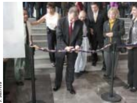
Inauguración de la exposición Arte en Roca .