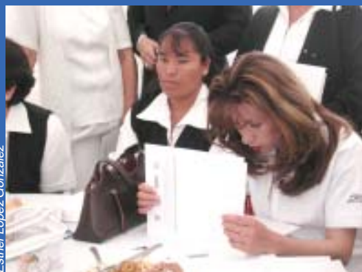
Una de las diplomadas que recibieron el aval respectivo.

El diplomado, con duración de 150 horas, fue cursado por 25 enfermeras que desarrollan su actividad profesional en la organización y promoción de redes de soporte comunitario con estrategias de intervención primaria para la prevención, y que están interesadas en su constante preparación para desempeñar un mejor trabajo en su área de competencia.