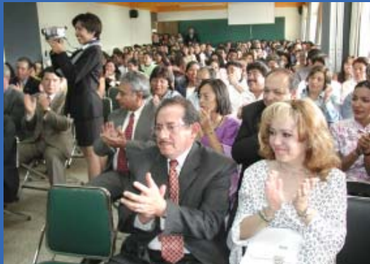
Aspecto del auditorio durante la ceremonia.

Al proseguir con su discurso, resaltó algunas particularidades que distinguen a esta clínica, por ejemplo, cuenta con dos alumnas que tienen el primero y segundo lugar de promedio más alto de toda la carrera, tres estudiantes que están inmersas en el Programa de Alta Exigencia Académica (PAEA) y una en el Programa Nacional de Becas de la Educación Superior (PRONABES), 14 profesores tienen una especialidad, seis cuentan con maestría, un profesor asociado es consejero universitario y dos profesores han obtenido distinciones académicas de la Asociación Dental Mexicana.