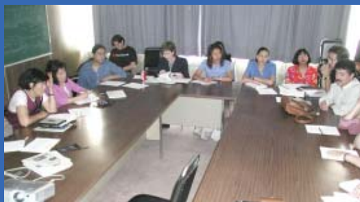
Aspecto de la reunión.

Por su estructura y características, el tronco común del que será el Nuevo Plan de Estudios de la carrera de Psicología de la FES Iztacala requiere de la participación de todos los profesores quienes, aglutinados en claustros, deben presentar sus propuestas al respecto, con miras a establecer las coincidencias existentes y realizar aportes que enriquezcan esta parte del proyecto de cambio curricular.