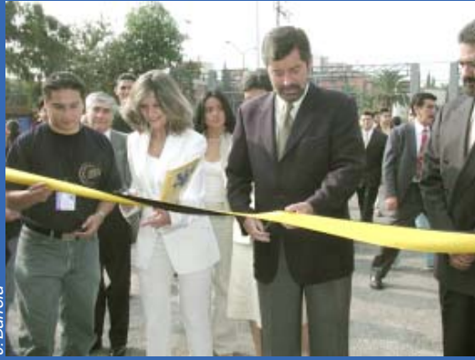
Momento en que el rector de la UNAM, Juan Ramón de la Fuente, corta el listón inaugural de la feria.

Como en las dos anteriores versiones, la FES Iztacala formó parte de la organización, junto con las demás escuelas y facultades de la Universidad Nacional, de la III Feria del Empleo UNAM 2003 , en la que durante tres días 143 empresas e instituciones públicas dieron a conocer sus ofertas laborales a 12 mil universitarios registrados vía Internet.