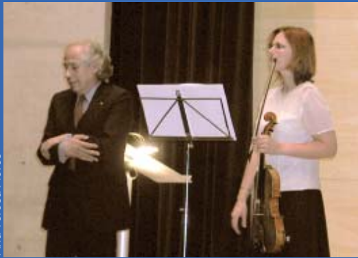
Espléndido obsequio para los galardonados.

reconocimiento a 25 años de servicio, lo que, considero, se dice fácil, pero que es un recuento que en ocasiones no se puede terminar de hacer.