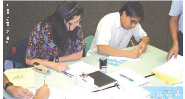
Aspecto del registro, celebrado en la Unidad de Seminarios de la facultad.