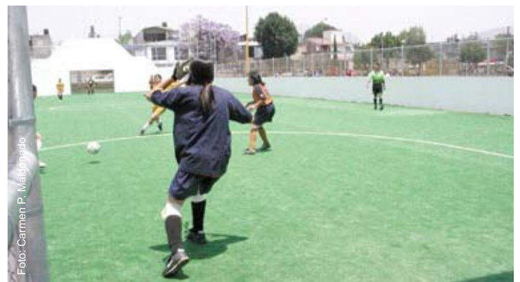
Acción en el futbol rápido femenino del Torneo Inter ENEP-FES 2004.