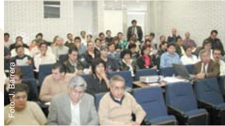
Asistentes a la sesión inaugural del curso.