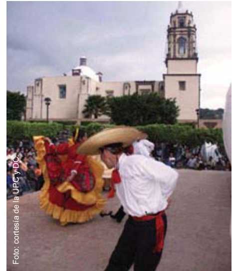
Grupo de Danza Folklórica Quetzal.

programa de actividades de la festividad, e hizo hincapié en que ésta fue la primera vez que nuestra escuela lleva una propuesta cultural a provincia, con lo que se marca la pauta que dará cumplimiento a una de las funciones sustantivas de la UNAM: difundir la cultura más allá de la población universitaria, a las comunidades que integran al país.