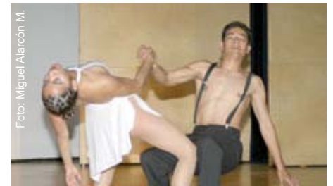
Grupo de danza contemporánea Dance Eros.