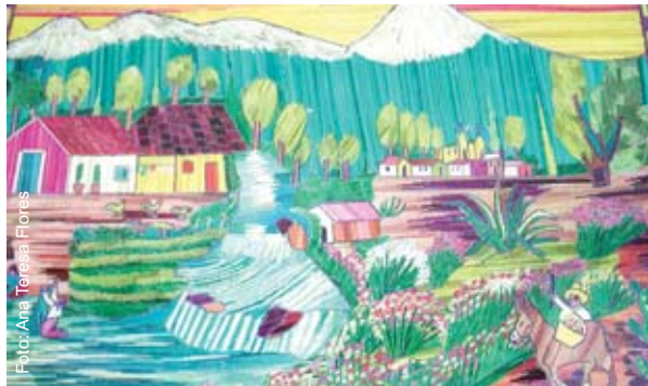
Una de las obras expuestas.

Muestra de miembro del Grupo Red de Apoyo a Adultos Mayores, impulsado por Psicología