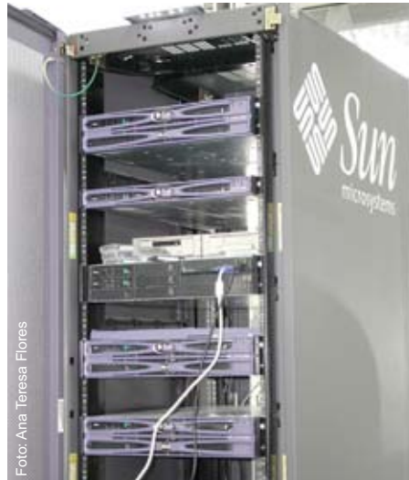
Rack de servidores de la facultad.

De esta manera, poco a poco se está logrando disminuir el ancho de banda ocupada, mecanismo perfectamente reglamentado por Dirección General de Servicios de Cómputo Académico (DGSCA), la cual tiene una serie de políticas de uso permitido, que establecen que el usuario