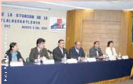
Aspecto del presidium durante la firma del convenio.