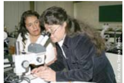
En el laboratorio, durante la revisión morfológica de las algas.

la fecha, se tienen 2 mil publicaciones específicas sobre el tema, y en todo el mundo se tienen registradas 400 especies de corallinas articuladas, en tanto que las incrustantes alcanzan los mil 600.