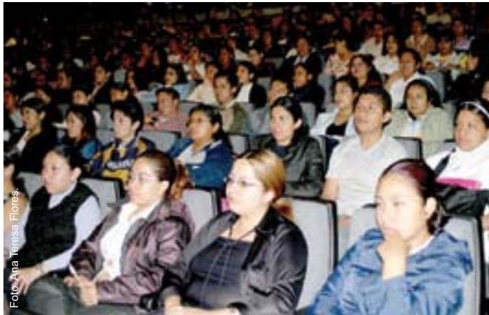
La actualización de conocimientos de los alumnos de medicina, una de sus principales preocupaciones. La nutrida asistencia al curso se mantuvo durante los cuatro días.

La farmacología es uno de los campos del conocimiento esencial para la formación de los médicos, por ello, la mesa directiva de la generación 2002 de la carrera de Médico Cirujano de nuestra facultad, integrada por alumnos de 7º semestre, organizó el curso de Farmacología: Antibióticos , con el propósito de que los alumnos actualizaran o reforzaran los conocimientos adquiridos en el aula e intercambiaran ideas y experiencias con los ponentes invitados.