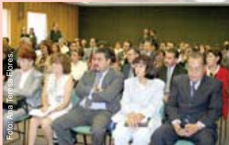
Asistentes al acto.

La Facultad de Estudios Superiores Iztacala y el H. Ayuntamiento de Tlalnepantla de Baz firmaron un convenio de colaboración para la realización de la Encuesta Municipal de la Mujer Tlalnepantlense , que busca detectar las necesidades psicoeducativas, socioculturales y económicas de las mujeres y familias residentes en este municipio.