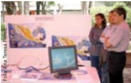
Foto: Ana Teresa Flores. Uno de los módulos de información del foro.

El interés por acercar las opciones de estudio en el posgrado a los estudiantes de licenciatura para continuar su preparación profesional, llevó a la División de Investigación y Posgrado de la FES Iztacala a realizar el Foro de Difusión del Posgrado , donde se dieron a conocer los programas de maestría y doctorado del área de las Ciencias Biológicas y de la Salud.