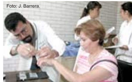
Determinación de glucosa, una de las pruebas realizadas durante la campaña.

Por otro lado, señaló que a partir de octubre se desea establecer un club para pacientes diabéticos, brindar pláticas a docentes sobre temas de relevancia en el área médica e incorporar, de manera formal, el programa de síndrome metabólico.