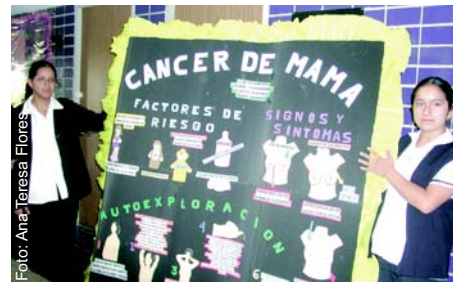
El periódico mural, uno de los recursos didácticos más usados por las enfermeras en sus programas de educación para la salud.