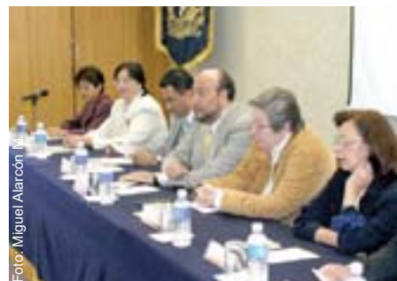
Durante la presentación del libro Contaminantes fisicoquímicos del agua. Sus efectos en el hombre y el medio ambiente .