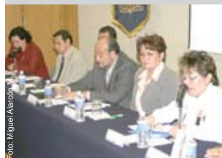
Foto: Miguel Alarcón M. Ceremonia de presentación del libro Historia natural de la enfermedad. Aspectos básicos para Enfermería .