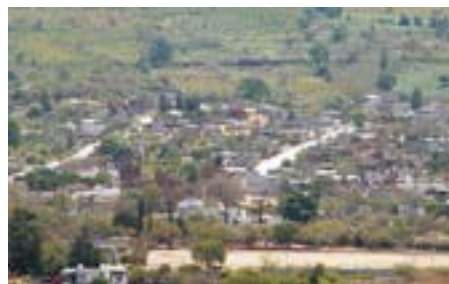
Panorámica del valle donde se ubica el municipio de Jungapeo, Michoacán.

Establecerá convenio con el municipio de Jungapeo, Michoacán