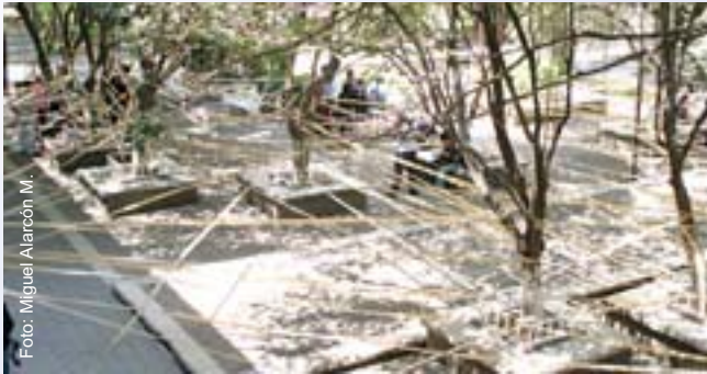
Performance en el que se representó el derecho a la libre circulación.

Organizada por el Proyecto de Vinculación con la Comunidad Estudiantil y la Sociedad de Alumnos de Optometría de la FES Iztacala