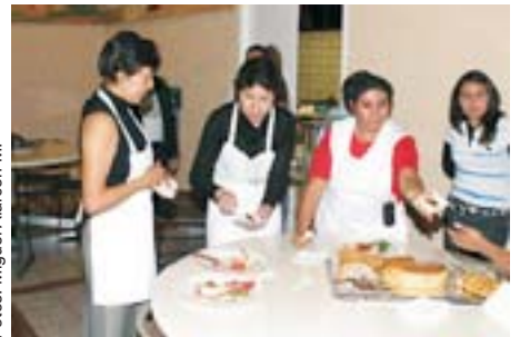
Participantes en el taller Cocina Navideña .