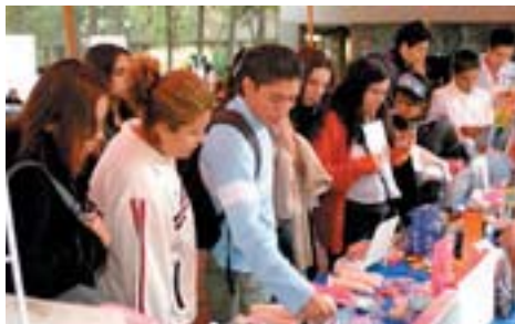
Afluencia constante de estudiantes a los diversos stands de la feria.