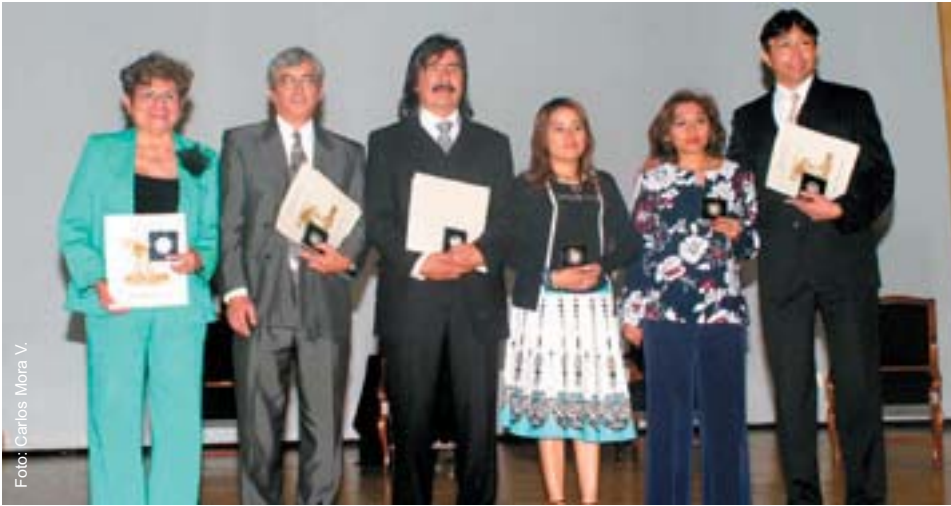
Galardonados con el Mérito Académico 2006.