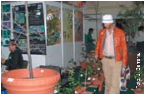
Local de la FES Iztacala en la exposición.

Única entidad académica invitada a la Expo Verde México , la FES Iztacala participó el pasado 23 de marzo en este foro de exhibición y divulgación de los actores involucrados en el sector ornamental del país, que tuvo como fin establecer vínculos de trabajo.