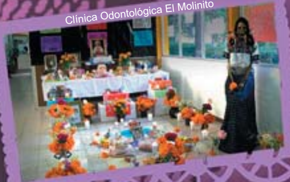
Clínica Odontológica El Molinito