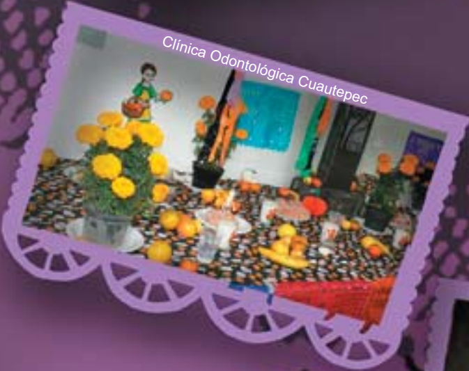
Clínica Odontológica Cuauhtepac