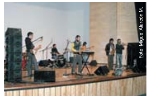
En días pasados la agrupación musical presentó a la comunidad iztacalteca lo más reciente de su producción.