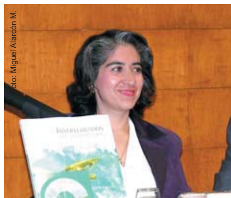
Deyanira Etaín Varona, coautora de Invertebrados no artrópodos .