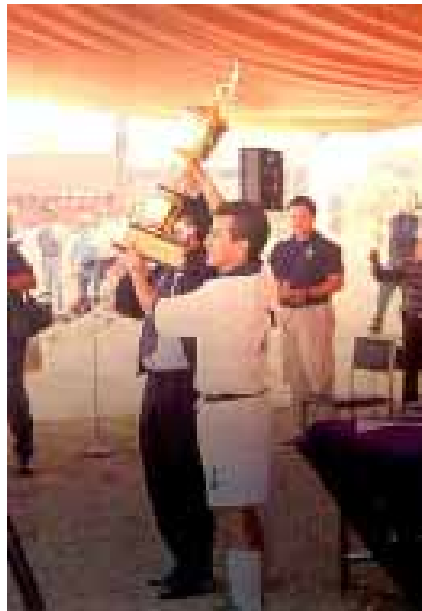
Regalo de aniversario. La Copa quedó en casa.

Durante el partido, a los linderos de la cancha llegaban y se iban estudiantes, a quienes al entrar se les entregaban banderines blancos conmemorativos.