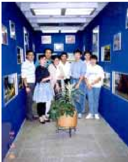
Equipo de trabajo del acuario.

Lugar donde el estudio de las especies acuáticas une a la academia y la investigación, y en el que la reproducción en cautiverio también forma parte de su quehacer, el Acuario de nuestro plantel es visitado en su área de exhibición no sólo por la gente de su comunidad sino también por la del exterior.