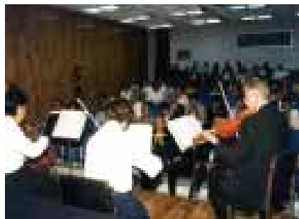
Como ya es tradición, el festejo concluyó con música.

Para cerrar con broche de oro la celebración, se llevó a cabo el concierto de aniversario con el cuarteto de cuerdas DUX, que durante más de una hora deleitó a los presentes con un variado programa.