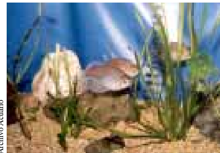
Peces de agua dulce y marinos son criados en este Centro de Apoyo.

Agregó que en este centro los jóvenes de Servicio Social no son "lava materiales", como sucede en muchos lugares, sino que aquí el prestador pasa por tres sub-etapas que tienen que ver, primero, con el conocimiento del manejo y montaje de un acuario, en el que se involucran aspectos de mantenimiento, para, segundo, darse a la tarea de estructurar un proyecto de investigación y, tercero, ponerlo en marcha, "afortunadamente, es en la mayoría de las ocasiones que los estudiantes que han pasado por aquí ese proyecto se continúa para formar parte de su tesis, y lo mismo sucede con los alumnos de tercera etapa". El biólogo Fernández indicó que el Acuario de Iztacala está abierto para apoyar a estudiantes de otras dependencias de la UNAM y señaló como ejemplo a dos alumnos de la Facultad de Ciencias que realizaron en éste, uno su servicio social y otro su tesis de licenciatura.