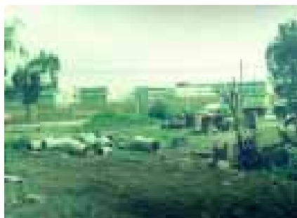
Lo que los pocos vecinos de los Reyes veían en 1975, a unos días del inicio de actividades de la ENEP-I.