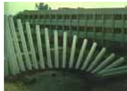
"La Cerca Caída", recién levantada.

"Yo tenía 22 años cuando entré con mucho entusiasmo junto con otros compañeros, éramos menos gente, había más unión entre nosotros, con los directivos, existía más comunicación, entre más edificios y gente hubo, disminuyó la relación. A pesar de eso, han sido muchas las satisfacciones que he logrado, tengo mi hogar y mi familia gracias a mi trabajo, me encantan los jardines y la limpieza del plantel, ya que dan una buena