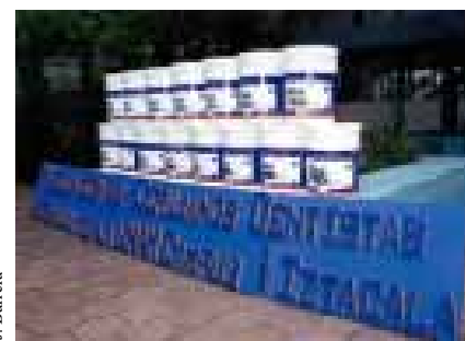
Con este donativo, los egresados inician una campaña de apoyo a las clínicas odontológicas.