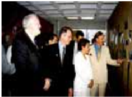
La exposición fotográfica de 25 años de historia de la ENEP-I, fue recorrida por dos de sus exdirectores y el actual titular de la dependencia.

Al referirse a quienes le antecedieron en la grave responsabilidad de conducir la escuela y que lo acompañaron en el presidium, destacó el esfuerzo realizado por cada uno de ellos, "ya que con su trabajo, dedicación, ánimo e impulso fueron construyendo las sólidas bases en las que hoy la institución se sustenta."