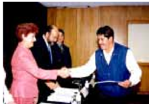
Los participantes en el Taller de Educación Ambiental y Gestión Municipal también recibieron reconocimientos.