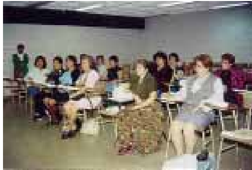
Participantes en el Curso de Adiestramiento Secretarial.