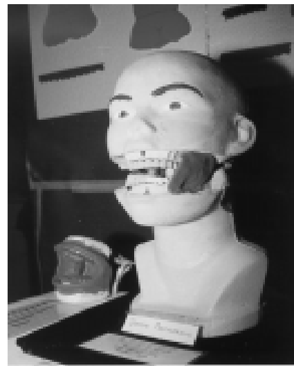
Una muestra de los trabajos presentados por los alumnos.