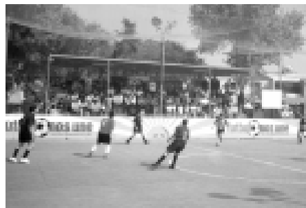
Un aspecto del torneo de Fútbol Rápido de la Clínica Ecatepec.

Añadió que el objetivo principal del Torneo se cumplió pues familiares y amigos de los jugadores se encargaron de animar los partidos, llenando las tribunas y alentando a sus equipos favoritos con sus porras creando un ambiente de camaradería.